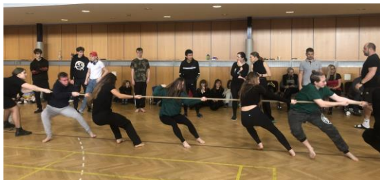
Vítězný tým 9.A